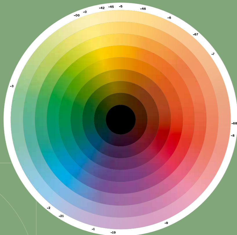
La Rueda del Color de IGORA ZERO AMM

Todas las fórmulas de IGORA ZERO AMM han sido diseñadas especialmente para usarse con la Loción Activadora a Base de Aceite de IGORA ROYAL o el Gel/Loción Activadora de IGORA VIBRANCE.